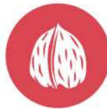
FRUTOS DE CÁSCARA