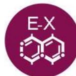
DIÓXIDO DE AZUFRE Y SULFITOS