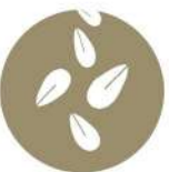
GRANOS DE SÉSAMO